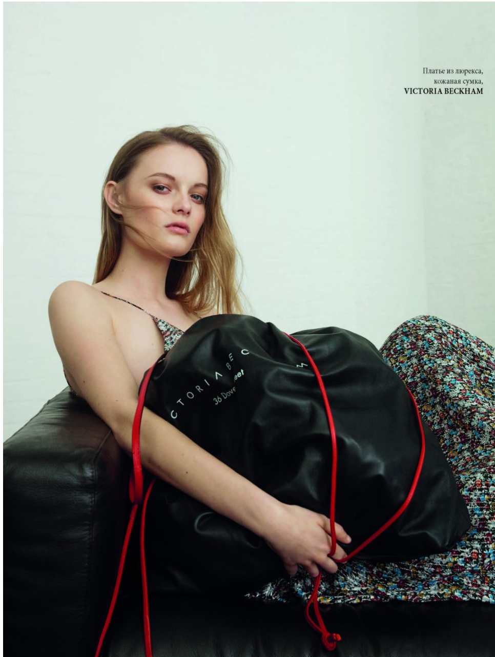
Платье из люрекса, кожаная сумка, VICTORIA BECKHAM