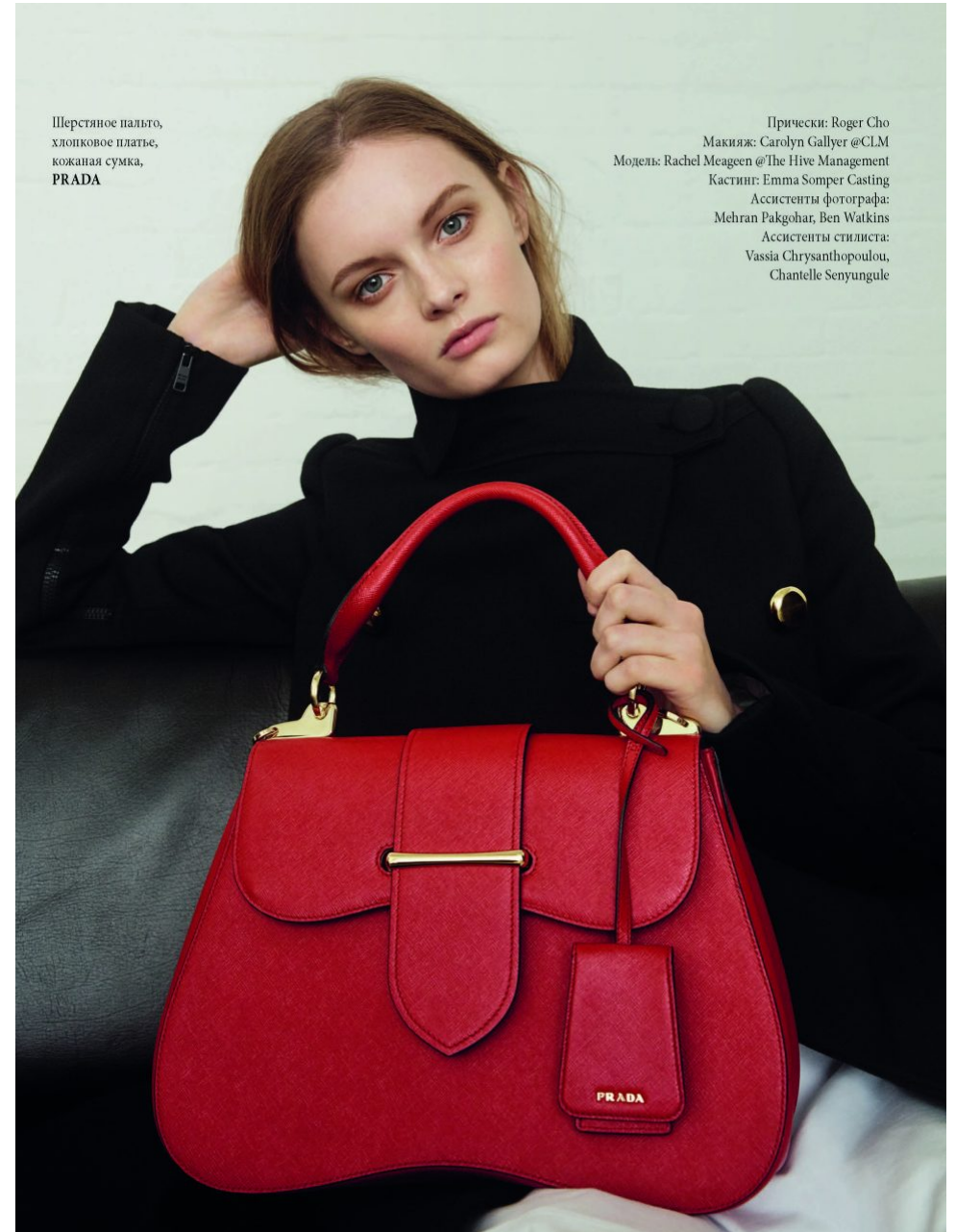
Шерстяное пальто, хлопковое платье, кожаная сумка, PRADA